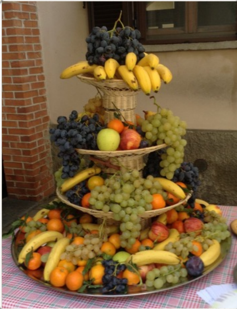
La frutta da... sorriso