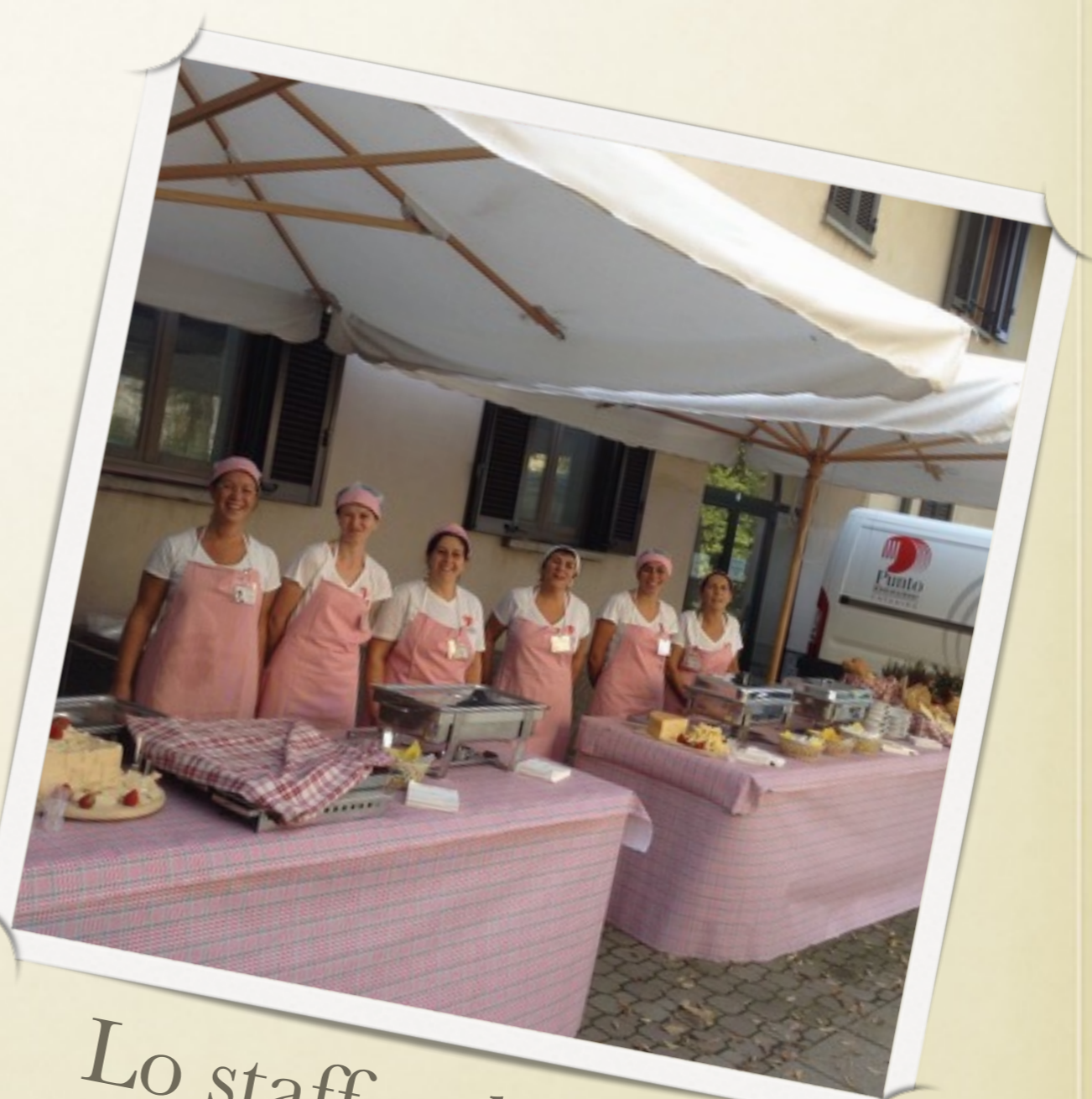
Lo staff col sorriso