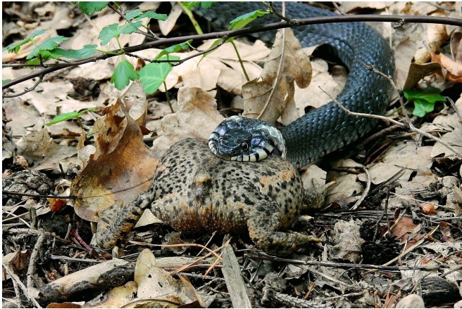
cobra che divora un anfibio